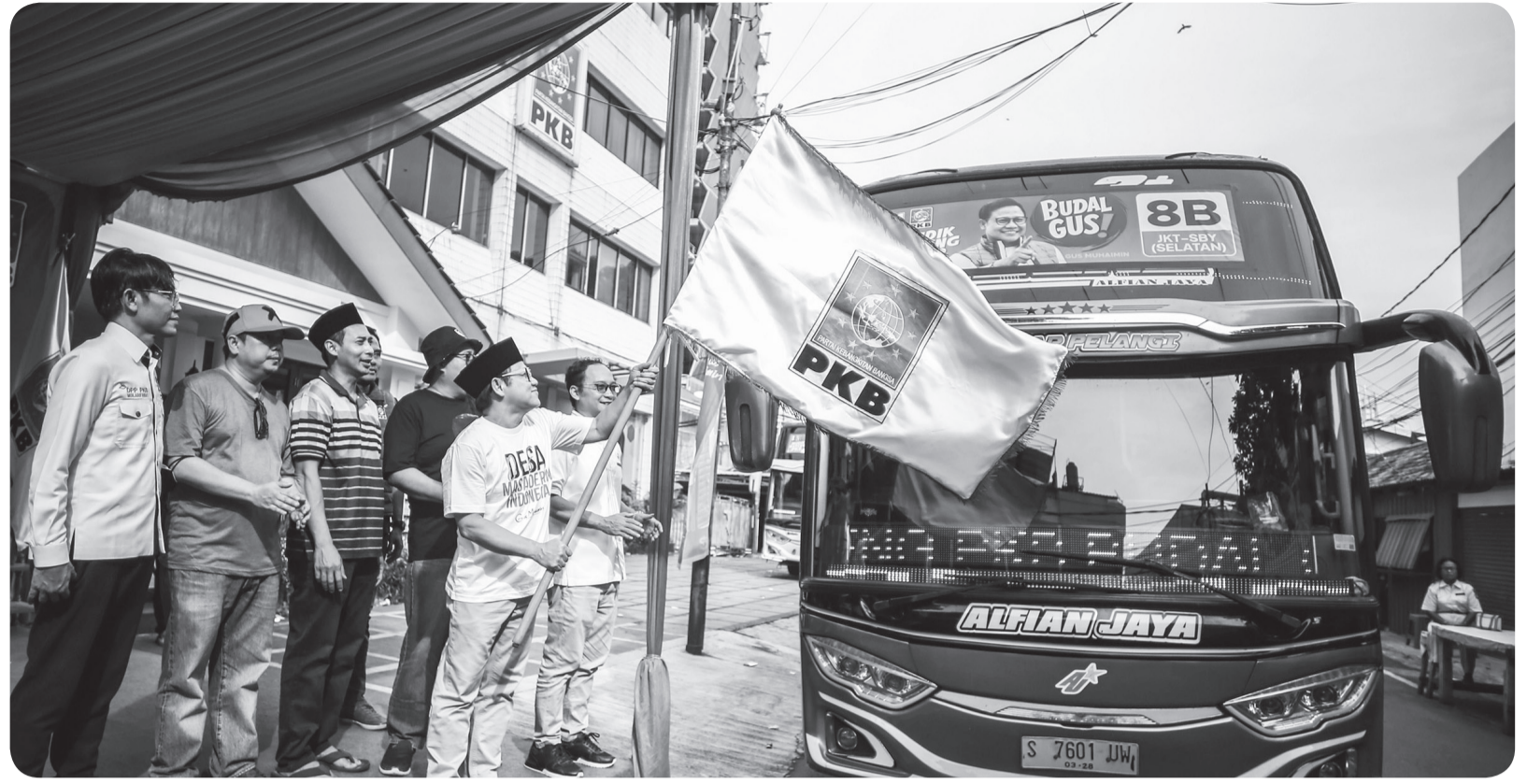
MUDIK BERSAMA PKB

Ketua Umum PKB Muhaimin Iskandar (kedua kanan) melepas peserta mudik bersama di Jakarta, Selasa (18/4). PKB membarangkatkan sekitar 2000 pemudik secara gratis dengan rute Jakarta-Surabaya.